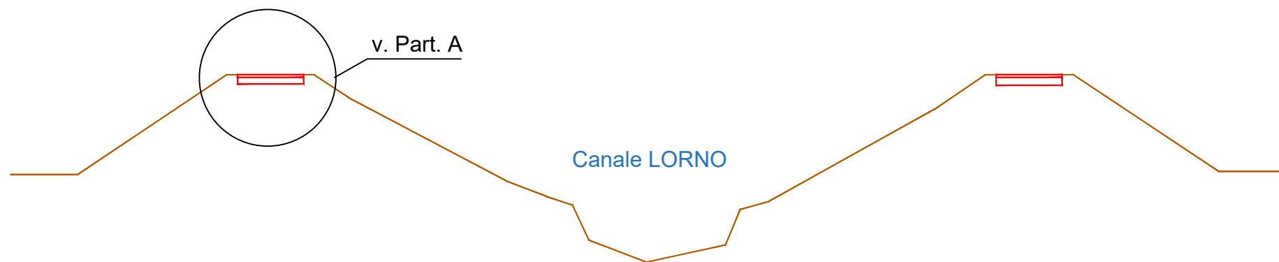
SEZIONE TIPOLOGICA A