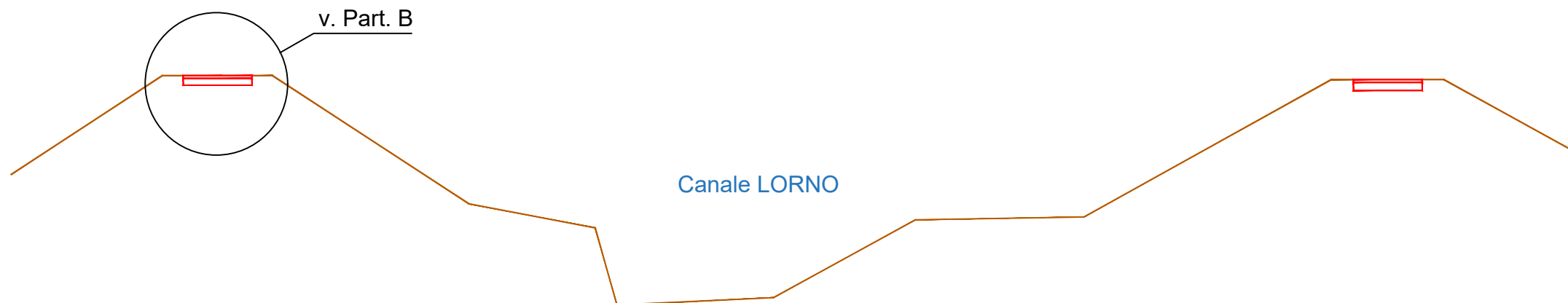
SEZIONE TIPOLOGICA B